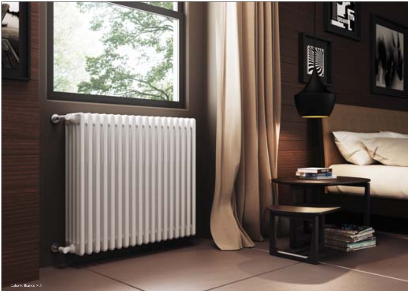
Colore: Bianco R01