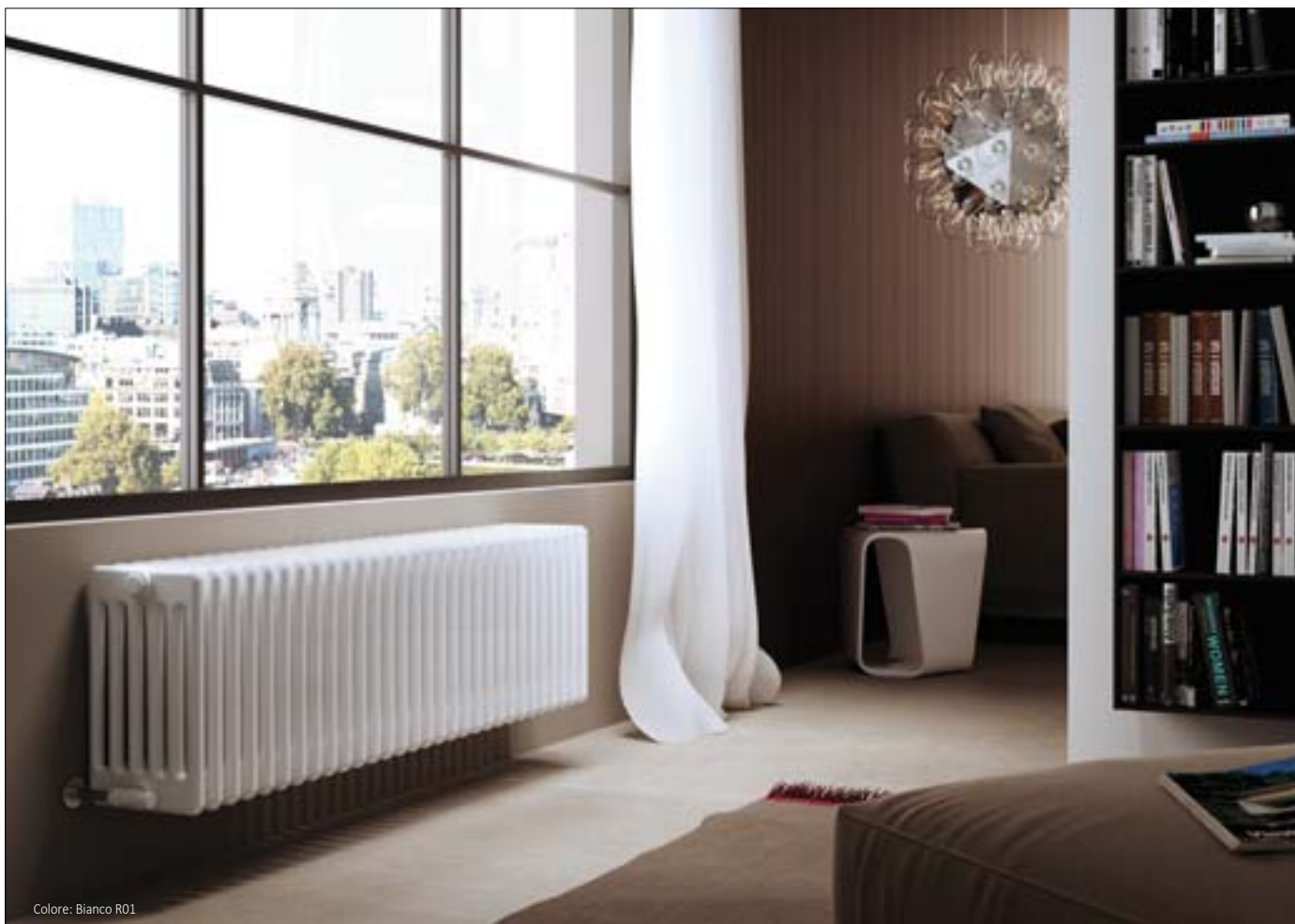
Colore: Bianco R01